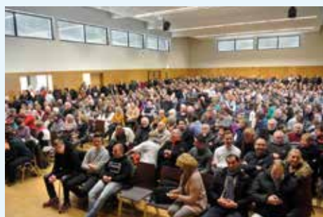
Tolle Beteiligung bei der letzten Bürgerversammlung